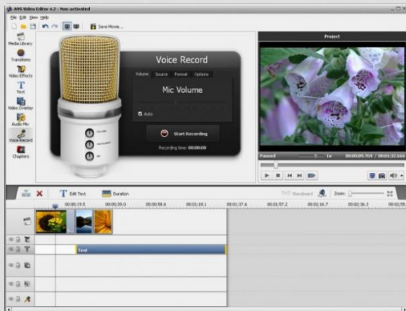
AVS video Editor 6.4